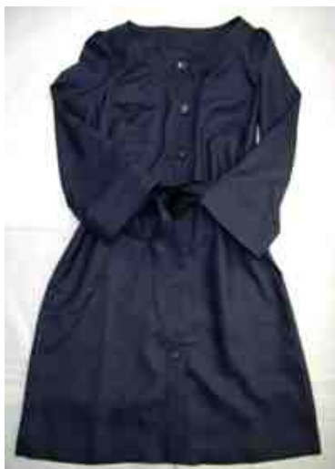
ANAYI サテンワンピース