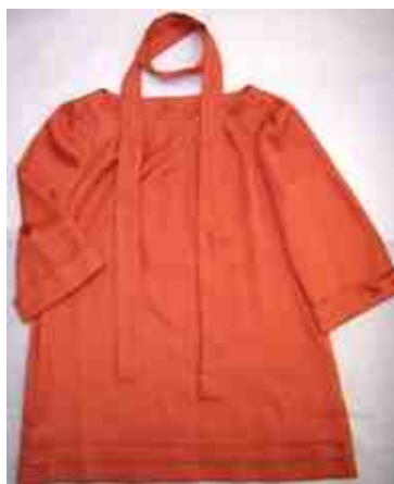
ノーリーズ サテンチュニック