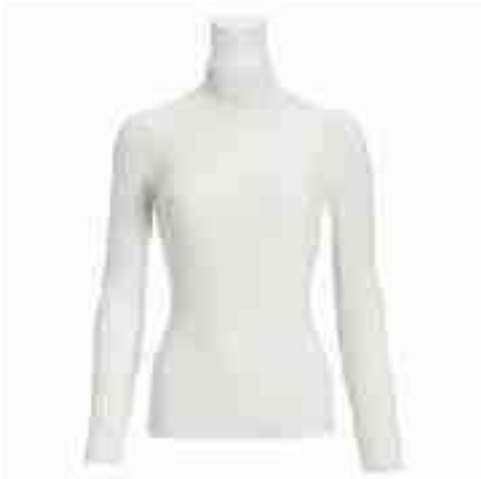
タートルネックカットソー