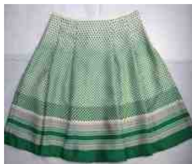
UA グリーンレーベル フレアスカート