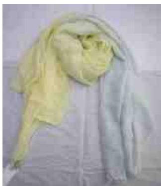
GALERIE VIE グラデーションストール