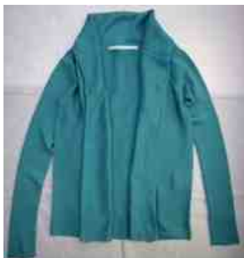
GALERIE VIE グリーン 2way カーディガン